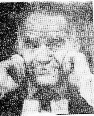
SAMIR Nemzetközi ellenőrzés

A meteorológiai intézet jelentése szerint ma is tart a meleg idő, de némi enyhülésre van remény, amely inkább holnap, szerdán válik érezhetővé. Várható mai hőmérsékleti értékek: Jeruzsálem, Cfát 23—33, Tel Aviv, Haifa 23—29, Afula 22—36, Tibériás 23—38, Ludd 22—33, Beér Sáva 20—38, Éjlát 26—44 fok.