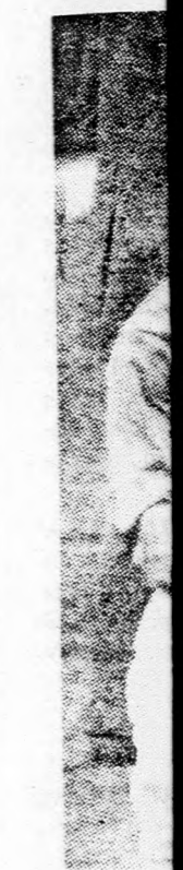
Otthon Ch... sélte a minis... küik el sem h... ták a távoll... Charles ráj... tudomásul... hölgy igen... tott!

Nemrégiben Charles trón s a gépen stewardess-közül kilenc nyörtöl és a kisasszony tett fel a kirá sori herceg lalkozik szab csinál álló é hozzátette a hölgy, hogy sa van Felse