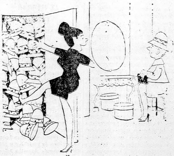
— Van az ön számára egy exkluzív modellünk. Egy kicsit drága, de egyetlen példányban készült...