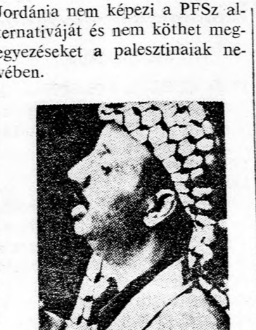
Beirutból közölték, hogy J. Áraráfát a közeli napokban Moszkvába jön, ahol a Kreml uraival az időszerű közelkeleti politikai fejleményekről tárgyal. A PFSz egyes vezetői azt mondták, arab újságíróknak, hogy Áraráfát moszkvai látogatásának közepontjában további fegyverszállítási kérés fog állni, elsősorban föld-levegő rakétákat illetően. A PFSz az utóbbi napokban azt a követelést vetette fel, hogy terjesszék ki a libanoni légvédelmi rakétahálózatot az ország egész területére és különösképpen a déli határvidékre. A szíriai külügyminiszter már közölte, hogy országa nem rendelkezik elegendő rakétával Libanon egész területének megvédelmezésére. Ugyanakkor országa szívesen biztosítja az áthaladási jogot minden, Libanon, vagy a PFSz által vásárolt fegyverszállításhoz.

A Szovjetunió és Jordánia között megállapodás jött létre, a két állam közötti első nagyobb fegyverszállítás ügyében. Beavott izraeli körök véleménye szerint az ügylet jelentősége politikai szempontból még nagyobb, mint hadászati vonatkozásban. Arab diplomáciai hírforrások, amelyek felfedezték ezt, közölték, hogy a fegyverszállítási ügylet SA-6 típusú föld-levegő rakétákat is magában foglalja. E rakéták feladata az, hogy megvédjék Jordánia légitérét külső behatolástól.