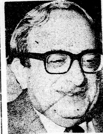
NAVON Barati tanács...

kapcsolatban Begin annak a re- ményének adott kifejezést, hogy szeptember, vagy október folya- mán mód adódik ezek folytatásá- ra.