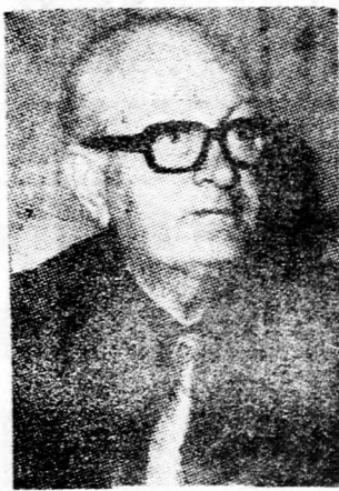
EHRlich az új földművelésügyi miniszter

Az új kormány megkezdte működését, 18 minisztere és 9 alminisztere van. Hogy különböző pártigényeknek, koalíciós követeléseknek és egyéni ambícióknak eleget tegyenek, egyes minisztériumokat kettőbe vágta, más minisztériumok vezetését pedig azzal duzzasztották fel, hogy alminisztereket neveztek ki főlébük, akikre senkinek semmi szükség, merőben feleslegesen. Ahelyett tehát, hogy takarékoskodnának a munkaerővel és az ezzel járó kiadásokkal, ismét visszatérnek a régi rendszerhez, felduzzasztják az apparátust, szaporítják a dolgozók számát, holott maga a kormány határozta el a személyzeti státusz rögzítését. Nyilvánvaló, hogy minden új miniszter és alminiszter titkárnókat s munkatársakat hoz majd magával, új hivatalok születnek, mindenkinek szolgálati kocsi és sofőrre lesz szükség, stb. Átlagos számítással az izráéliek adófizetőinek minden egyes új alminisztere havi egy millió se keljébe fog kerülni, miközben a hasznosságuk legalábbis kétséges. Köztudomásu, hogy az alminiszterek szaporítása csak bonyolulttá teszi a munkamenetet, szükségte lenül és észérületlenül zavarja az ügyintézt.