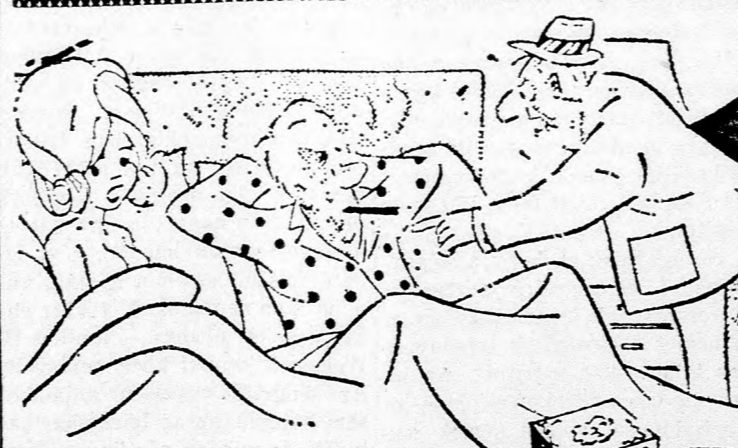
— Ugy, szóval maga szokta elszívni a szivarjaimat!

Dohányozni a munkahelyen tilos. Szeszt inni nem szabad.