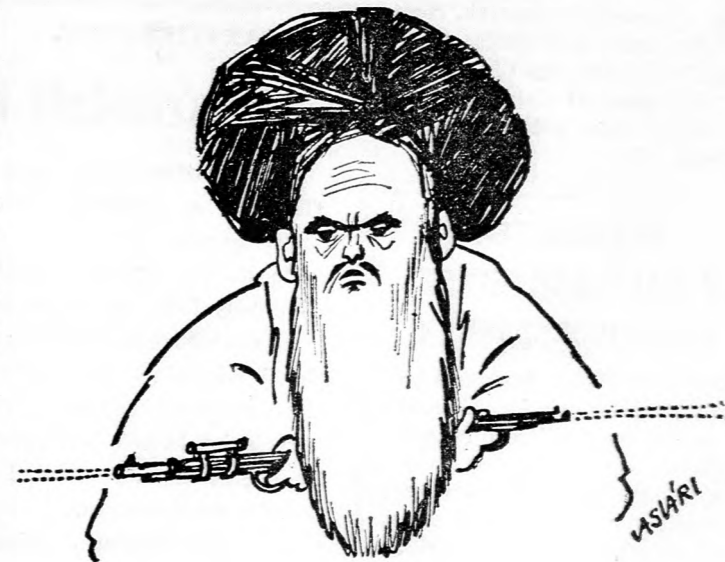
CHOMEINI Meggzsidult bárányka?

nem szabad arra készítenie a hatóságokat, hogy kegyetlenkedjenek a foglyokkal és a rabokkal, vagy letartóztassanak ártatlan embereket. Az ügyészek és a bírák feladata — hangsúlyozta, — hogy megbüntessék a bűnsöket és szabaddá helyezzék az ártatlanokat, az Iszlám törvényeinek megfelelően. Mi több, — hangzott — az elmaraszt-