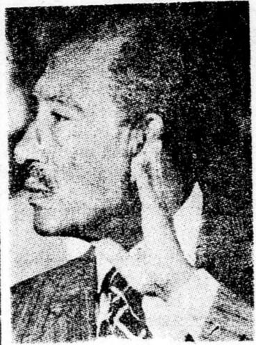
SZÁDÁT Erélyes lépések

★ Megtiltják a vallás felhasználását politikai, vagy párt-célokra;