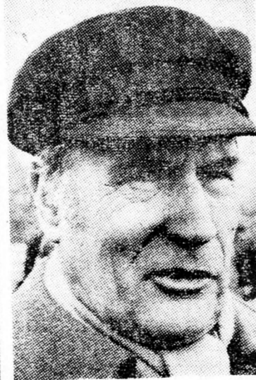
MITTERRAND Fonák helyzet...

Francois Mitterrand francia államelnök kérte libanoni hatóságoktól, hogy tájékoztassák a nyomonkérés minden részletéről. A Párizsban tartózkodó izraeli újságírók jól ismerték az 59 éves Louis Delmart, aki 1975 és 1979 között a francia külügyminisztérium szóvivője volt és általában baráti kapcsolatokat teremtett az izraeli sajtó kiküldöttjeivel, annak ellenére, hogy nagyon jó kapcsolatai voltak az arab világgal.