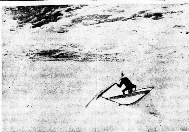
...KI TUDJA HOL ALL MEG

A nehéz anyagi helyzet miatt sok kézműves helyzete tarthatatlan és a hitel-hiány veszélyezteti foglalkoztatásukat. Ezért tehát arra kérik a kormányt, hogy legyen minél hamarabb segítségükre. Ezen kívül azt is kéri a kormánytól, hogy állítson megfelelő területeket újabb központok létesítésére, amint azt a tel-avivi városi tanács már sikeresen megtette.