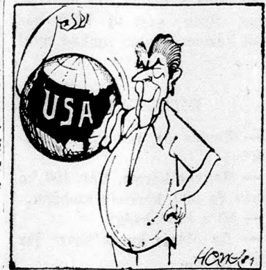
REAGAN ÚJ KÉPZELI

Az újságíró, aki ráv Goren magatartását akarta kikarikirozni, megsértett primitív ötletével