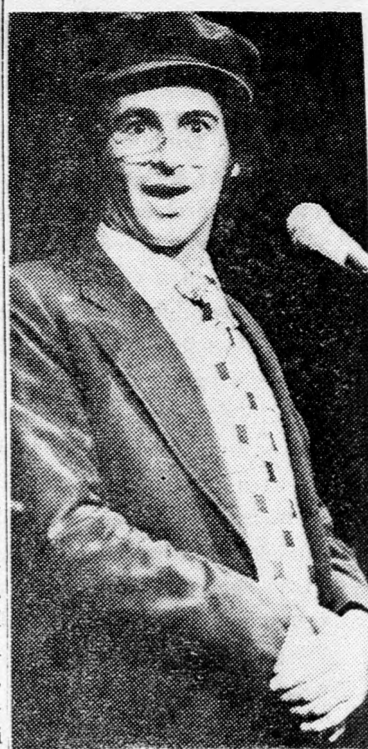
adásra a Héjchál Hátárbutban kerül sor, október 10-én.

Moti Giládi a televízió népszerű mulattatója első ízben lép fel jiddis nyelven Izraelben, a „Spilt klezmerleh spilt” című előadásban Tesu Solomonovici produkciójában. Moti Giládi a hadseregben kezdte karrierjét és rövidesen országos hírnévre tett szert. Azóta az izraeli közönség számtalanszor láthatta filmen, a televízióban és a színpadon. Sokoldalú művész, énekel, játszik, szaval. Legismertebb képessége azonban politikai életünk jelességeinek az utánzása. Moti Giládi sikerrel szerepelt külföldön, főleg Amerikában, angol nyelven. Izraelben először lép fel jiddis szöveggel, de már játszott ezen a nyelven... Ausztráliában. Ugyancsak jiddisül szólalt meg Anversben, ahová a belga királyi ünneplése alkalmából hívták meg. A produkcióban még fellépnek Jenny Kessler, Anabella, Erika Pheifer, Kochá-vá Hárari, N. Wolfovici, Cwi Goldberg, Jacov Cohen és a „Hárikudim” táncgyűttes. Az elő-