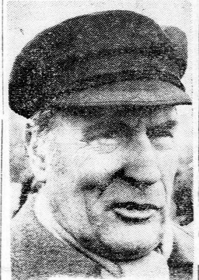
MITTERAND: „Izrael-barát vagyok...”