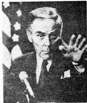
HAIG Megváltozott a fontossági sorrend

Haig hangoztatta, hogy a következő hetek döntő fontosságúak lesznek a Camp David-i megállapodások szempontjából és fontos, hogy haladás történjen az auto-