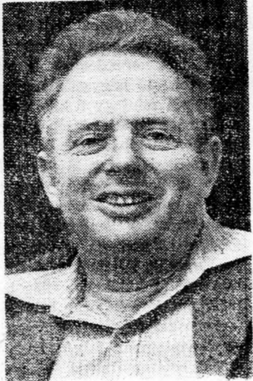
igazgatóságot. Megdöbbenő az, hogy a csoport tagjai politikai

A Rádióhatóság szóvivője azt mondotta, a hírre reagálva, hogy az igazgatóság megteszi a megfelelő lépéseket minden olyan kérésrel szemben, melynek lényege illetéktelen beavatkozás az ügyek vezetésébe. Mindössze egy alkalmazott-csoportról van szó, amelyik visszasírja a régi, felelőtlen időket és uszítja a dolgozókat. Ez a csoport arra használ-