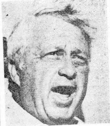
SÁRON „Megvédjük biztonságunkat!“

jelentését, amely szerint előrehaladásra került sor annak az okiratnak a megfogalmazásában, amely