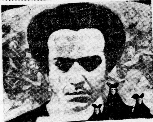
MOZART ★ JOSEPH LOSEY „DON GIOVANNI”

3. Zsidó elnöklélt — mert az amerikai történelem hebizonyította, hogy a politikai pártok nem riadnak vissza előítéletek ki használatától, ha az érdekeiket szolgálja. Ilyen esetben az ellenpárt nem tétovázna, hogy antiszemita eszközökkel akadályozza meg a zsidó jelölt győzelmét.