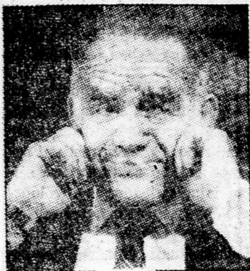
SÁMIR Szükséges szombatszégés és az Águdát Jiszráel — bizalmát is élvezi.

A bűncselekmény elkövetésére a múlt héten tartott pénztár-ellenőrzés derített fényt. Rappaport nemlétező nevekre utalt ki, illetve vett fel nagyobb összegeket. A bíróság négy napos letartóztatási végést bocsátott ki az ügyben.