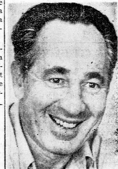
PERESZ Egyértelmű bírálat

A Szinájban felállított nemzetközi ellenőrző haderő képezte a központi témát Peresz előadásában, amelyet Londonban tartott franciaországi látogatásának befejezése után. Peresz, aki a labur-