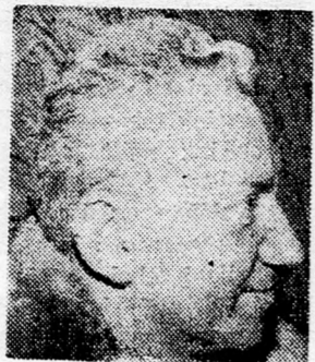
BAR-LÉV Sokretű átszervezések

Chájim Bár-Lév Kneszet-képviselő, a Munkapárt főtitkára, akit csütörtökön nagy többséggel ujjravezették, át akarja szervezni a pártot. Mota Gur, volt